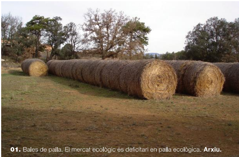
01. Bales de palla. El mercat ecològic és deficitari en palla ecològica.

1. Aquest article presenta alguns dels resultats d'un estudi que avaluava les conseqüències d'aquest desequilibri i que va dur a terme el passat estiu del 2008 el Departament d'Agricultura, Alimentació i Acció Rural, conjuntament entre el Departament de Ciència Animal i dels Aliments de la Universitat Autònoma de Barcelona i l'Institut de Recerca i Tecnologia Agroalimentàries de Monells. Es realitzaren 84 visites a explotacions ramaderes ecològiques, que foren seleccionades aleatòriament del registre del CCPAE. D'aquestes, 65 eren granges de bestiar ecològic, 15 finques dedicades a la producció d'aliment pel bestiar ecològic i 4 mixtes que feien les dues tasques. Aquesta mostra representa un 21% dels ramaders ecològics de Catalunya.