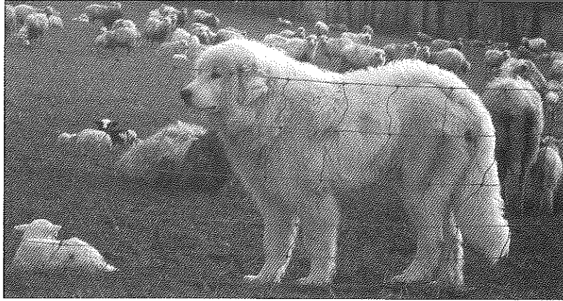
El Gos de Muntanya pot estar al mig del ramat com una ovella més.

d'evitar que a través d'aquests jocs el cadell es torni massa violent, ja que podria ferir greument als xais i certes ferides podrien comportar la mort. Cap a l'edat de quatre mesos el cadell pot ser incorporat al ramat. És important seguir atentament aquest període de transició per poder intervenir ràpidament en cas d'algun problema. A la vegada es vigilarà que el cadell no s'aparti del ramat molta estona. Si no torna ràpid se'l tornarà de seguida cap al ramat. Si el cadell persisteix en quedar-se on no deu, se'l tornarà al seu corralet inicial durant dos o tres dies, abans de reintegrar-lo de nou al ramat. El gos de protecció no se l'ha d'acariciar sovint. Com més carícies, la unió entre el gos i la persona que l'acaricia es reforçarà, en detriment de la seva afeció al ramat. Això no impedeix que pugui ser acariciat en certes ocasions, per exemple, quan se li dona el menjar o quan controla el ramat enmig de la pastura. No s'ha d'acariciar a través del tancat o al voltant de la casa del pastor, ja que es corre el risc que passi molt del seu temps en aquests llocs i lluny del ramat.