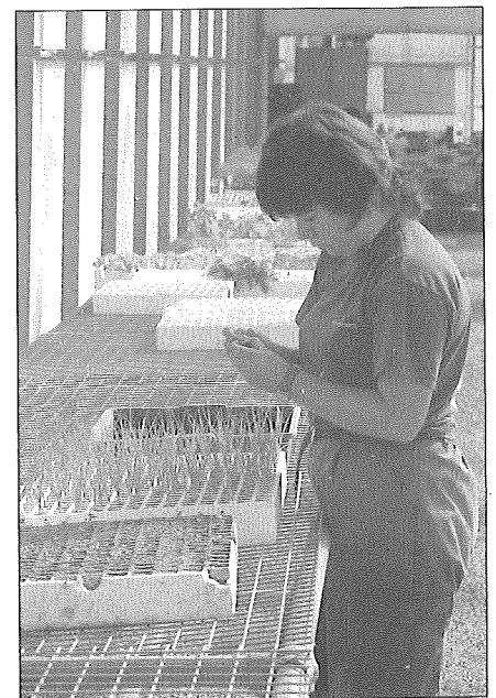
Les feines per fer planter i llavor han començat el 2005 i es pretén produir suficient material per comercialitzar a tota l'illa. Ll. P.

Son Roca acabava de ser travessada per les obres del futur segon cinturó de Palma, el que en diem via cintura. Ara teníem dos sectors separats, un a llevant —d'unes 3 hectàrees— i l'altre a ponent —amb les cases— amb les 17 hectàrees restants. A més d'aquesta realitat urbana que teníem —i tenim— a les portes, ens afecta una situació encara més preocupant: la mort del món rural de l'illa de Mallorca. Sé que aquesta afirmació sorprendrà a molta gent que coneixi l'illa, perquè la impressió a sim-