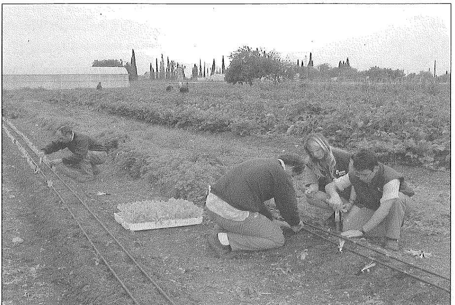
Persones treballant a l'hort. Els productes es venen a Son Roca, i al restaurant i a la botiga que té Amadip. Esment a Palma. Ll. P.

El projecte, com no podia ser d'altra manera, fou concebut des de premisses de màxim respecte ambiental. Es va tenir des del començament una cura escrupolosa amb la tria dels materials. Tots han estat elegits tenguent en compte que en la seva composició, fabricació, ús i rebuig es produís el menor impacte ambiental: no hi PVC, ni coles, ni pintures, ni metalls pesats... En el disseny dels tallers es va tenir esment de totes les mesures de climatització passives possibles: l'orientació i el color interior permeten escalfar les naus amb el mínim d'ús energètic, l'orientació i el disseny interior permet una circulació creuada d'aire durant l'estiu que fa innecessari la refrigeració.