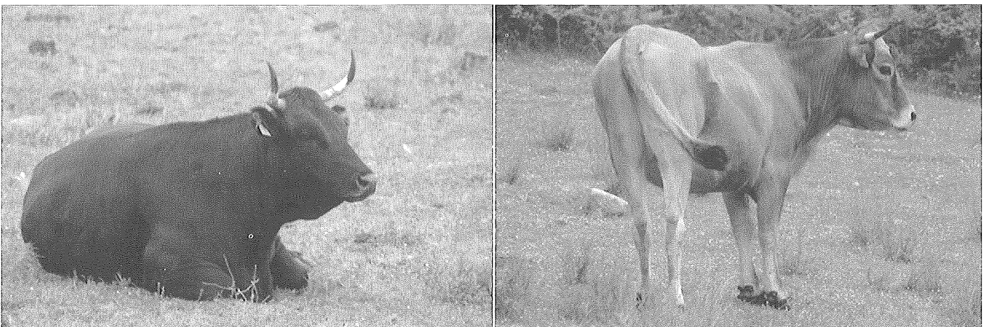
Dues de les varietats de la mateixa raça alberesa, típica de la serra de les Alberes, a l'Alt Empordà (Girona). Pere-Miquel Parés i Casanova.

Uns bons exemples són la vaca alberesa i la cabra blanca de Rasquera, races capaces d'aprofitar recursos vegetals molt pobres. Ara bé, és important adonar-se d'un fet que sovint ha generat massa tòpic sobre aquesta elevada rusticitat de les races autòctones. Una cosa són els marges de tolerància d'una raça, i l'altra, els marges òptims de producció. Ésser capaç de viure a temperatures nocturnes inferiors als 0°C (és el cas del cavall bretó cerdà) no vol dir fer-ho amb igual eficàcia que a 20°C. Això vol dir que una raça susceptible de viure en un ambient determinat no té per què estar-