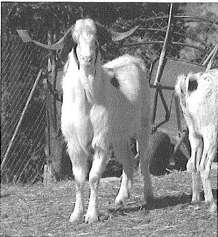
Un boc de raça rasquerana. Pere-Miquel Parés i Casanova.

Les motivacions per conservar les races autòctones es poden resumir en sis punts: